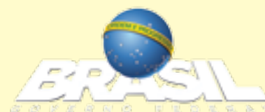
IMAGEM QUE PRECISA SER TAPADA DURANTE O PERÍODO ELEITORAL