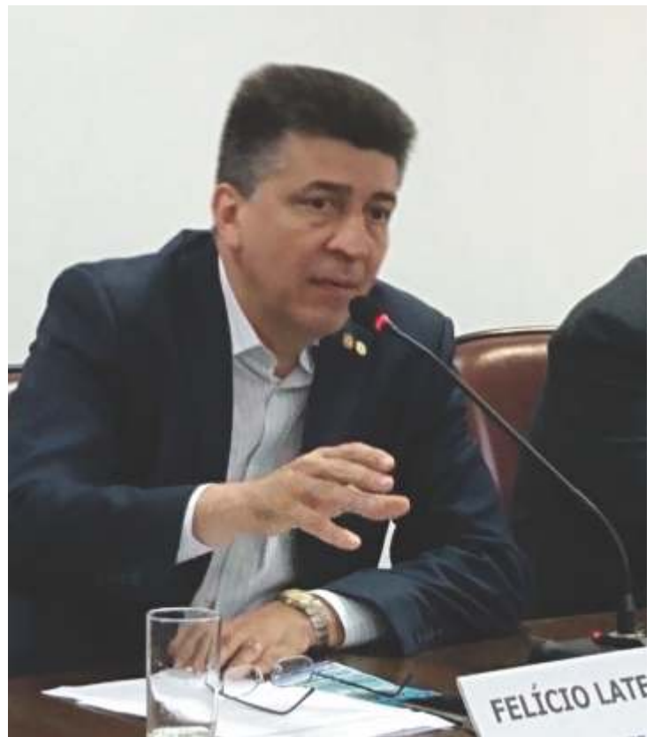
Deputado federal Felício Laterça falando aos presentes

O deputado federal lembrou Aristóteles: “Tudo passa pela política”. E afirmou que a mobilização dos empresários é extremamente necessária: “Apoio o empreendedor, que emprega o farmacêutico, mas que tem sofrido com multas, quando esse profissional vai almoçar ou outra coisa simples. Multas absurdas de 70 mil, 90 mil, a ponto de fechar farmácias de pequeno porte. Tenho disposição para lutar, os abusos são inúmeros. Não tem limite o que pessoal está fazendo. Após a minha fala sobre a situação das multas no Congresso Nacional, esse assunto repercutiu no Brasil inteiro e fui procurado por muitos Sincofarmas, empresários e farmacêuticos que estavam passando por situações diversas de distorções e multas excessivas.”