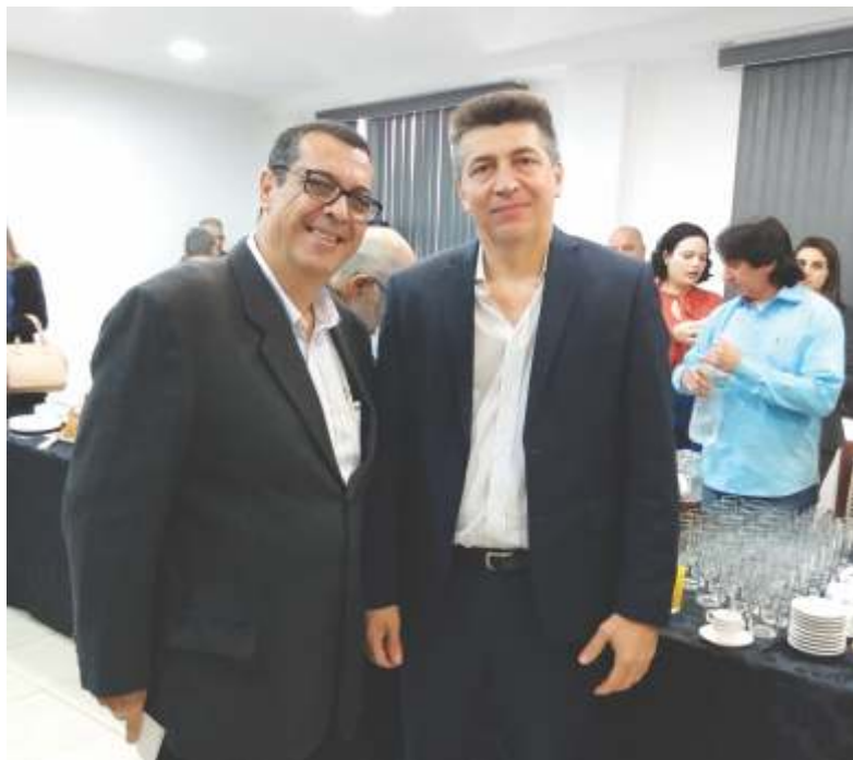
Presidente Felipe Terrezo e o deputado federal Felício Laterça