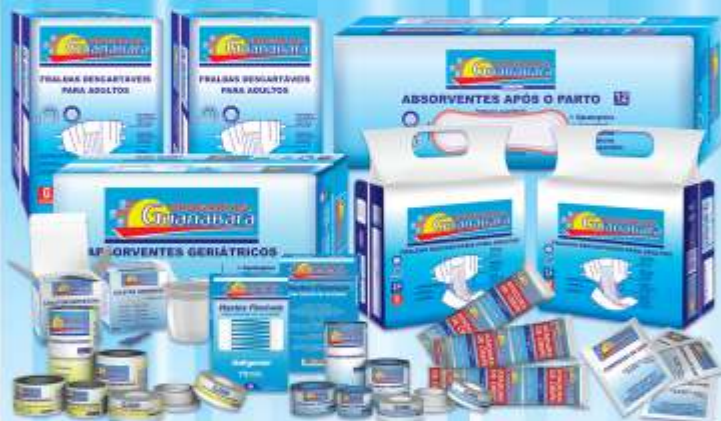
Produtos de Marca Própria