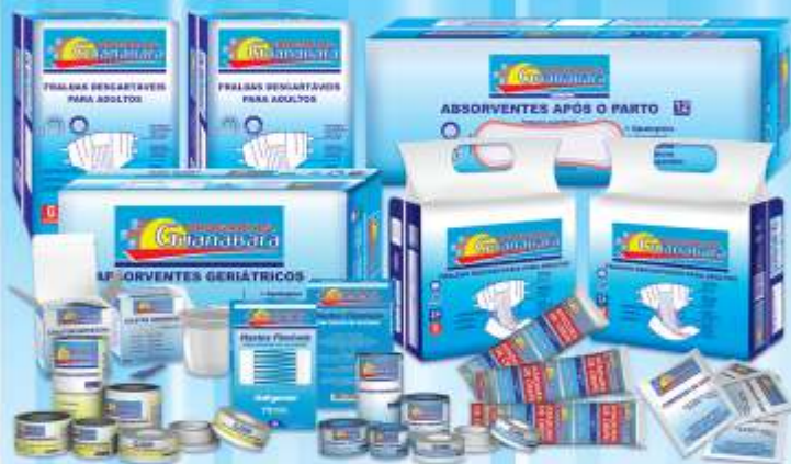
Produtos de Marca Própria