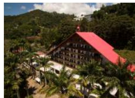
SESC Alpina (Teresópolis)