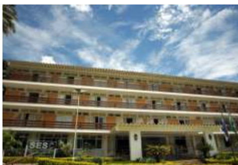
SESC Nogueira (Petrópolis)