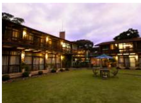
SESC Nova Friburgo

Também haverá atividades formativas, como oficinas, cursos, debates, seminários, fóruns, palestras, residências e mentorias artísticas. A programação completa desta 19ª edição, que reunirá atrações de projeção nacional e artistas locais, será divulgada em breve em www.sescrj.org.br .