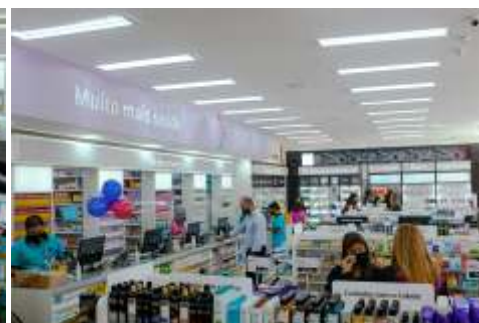
Interior da loja