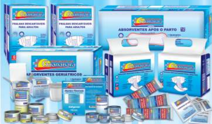
Produtos de Marca Própria